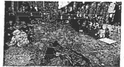
Inizio serata: primi bivacchi in piazza Verdi