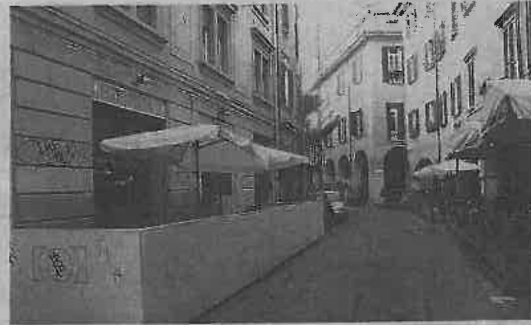
Da rimuovere i dehors di via Petroni sui quali si è pronunciato ieri il Tar

Inoltre i giudici hanno ritenuto insufficienti le considerazioni dell'amministrazione comunale sui dehors, giudicati «una parte del piano di riqualificazione di via Petroni»: secondo il Tar invece di migliorare la vivibilità della zona, la peggiorano, e ha condannato Palazzo d'Accursio al pagamento di 2 mila euro per le spese legali. Adesso i cinque locali interessati (Balanzone, Birroteca Lupulus, Caffè Petroni, Cucchiaino d'Oro e Green River) aspettano di conoscere le